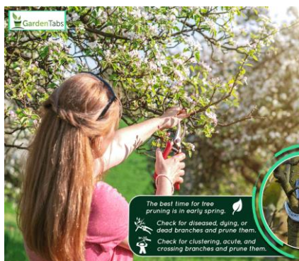
Figura 4. Krasitja e pemëve frutore nga nxënësit.