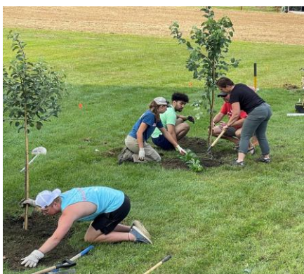
Figura 3. Mbjellja e pemëve frutore nga nxënësit.