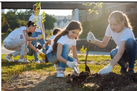
Figura 7. Mbjellja dhe plehërimi organik i drufrutorëve nga nxënësit.

Prezantoni teknologjinë e prodhimit të përdorur para mësuesve, nxënësve dhe palëve të tjera të interesuara.