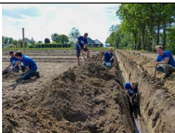
Figura 5. Instalimi i sistemit të vaditjes në një plantacion me arra nga nxënësit.