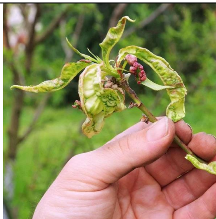
Figura 8. Identifikimi i sëmundjeve në pemët frutore nga nxënësit