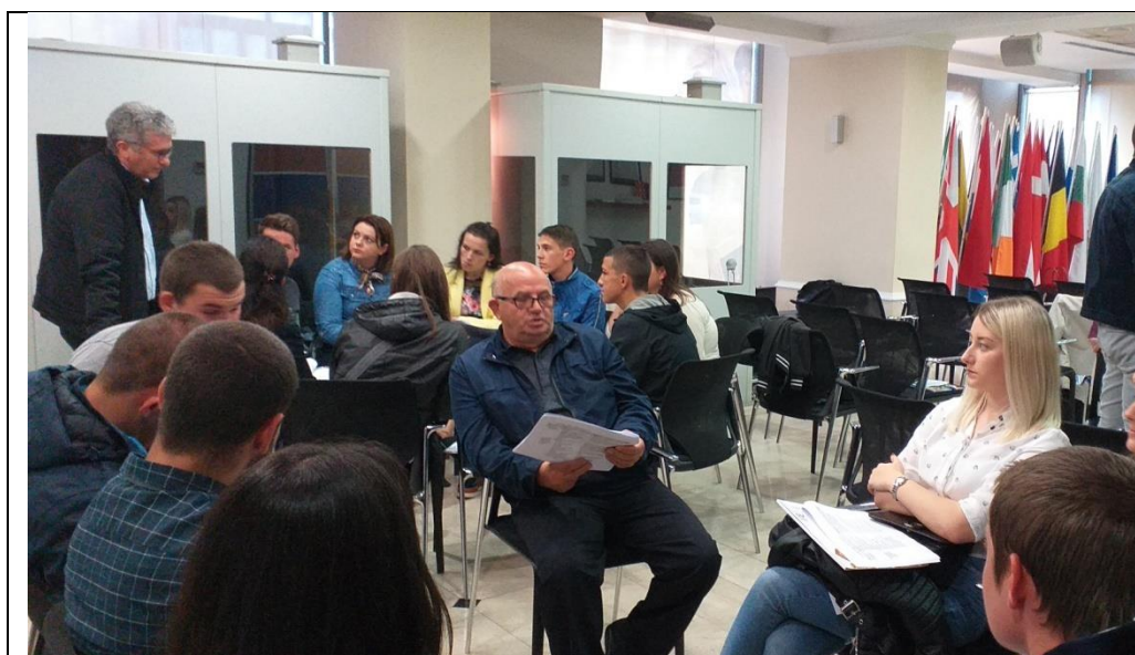
Figura 2: Orë mësimi interaktive